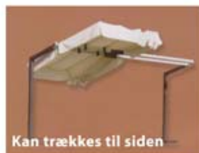
Kan trækkes til siden