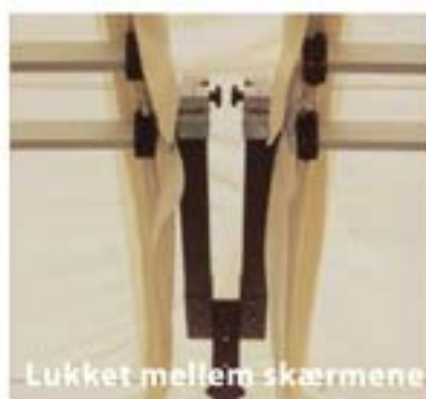
Lukket mellem skærmene