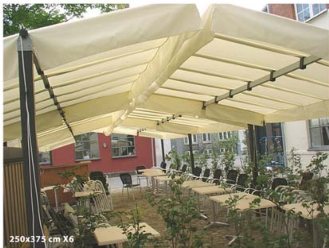
250x375 cm X6