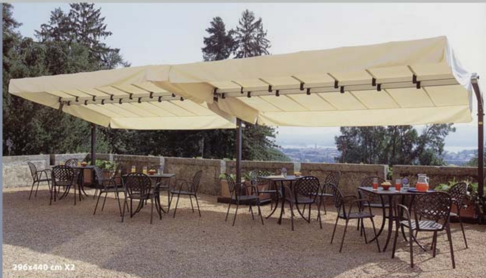
296x440 cm X2